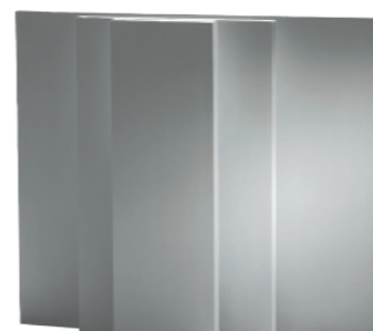
Konstrukční desky SKAMOTEC 225 lze snadno řezat do jakéhokoli tvaru nebo na jakoukoli velikost.